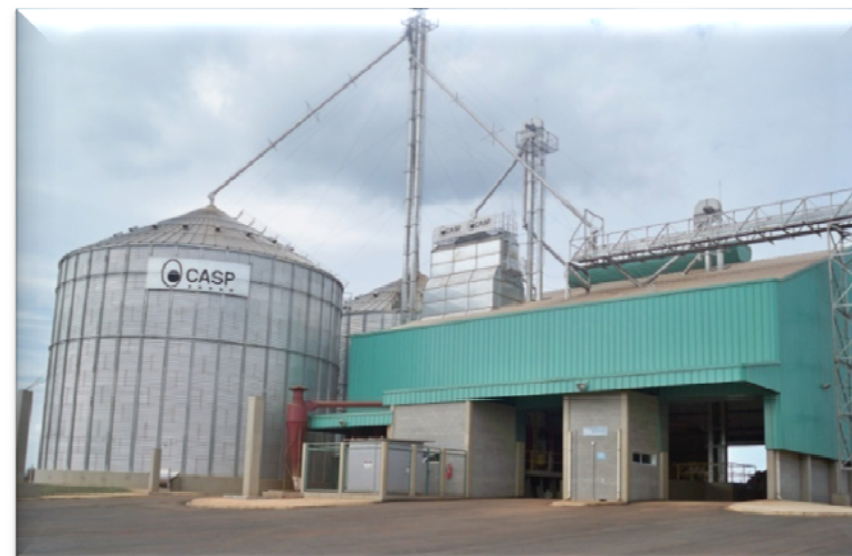
Silo recebimento soja