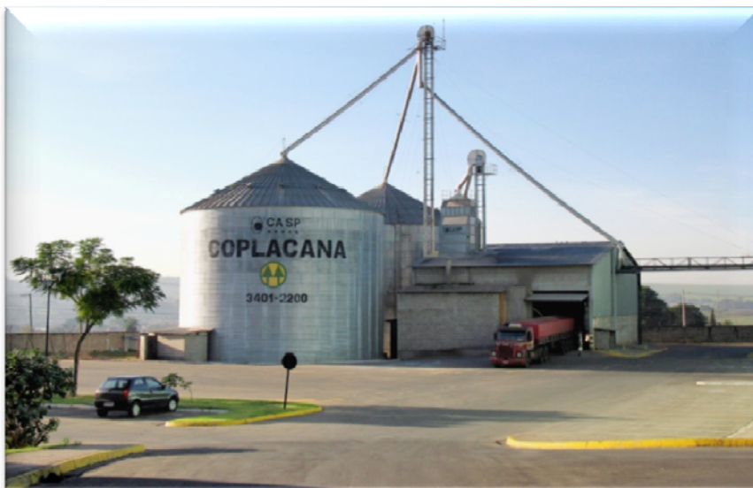
Silo recebimento milho