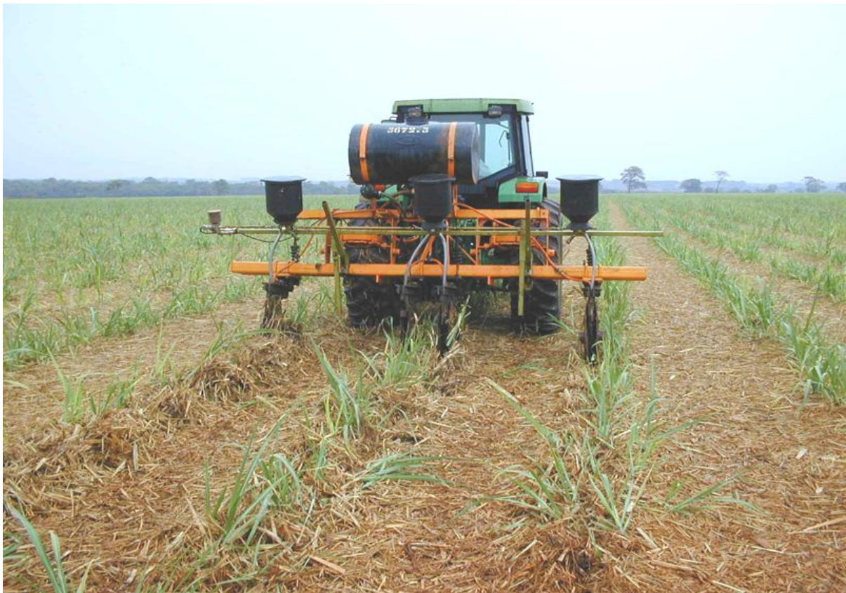
FIGURA 08: APLICADOR DE SOQUEIRA