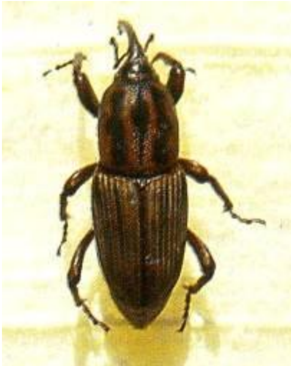
FIGURAS 1. ADULTO