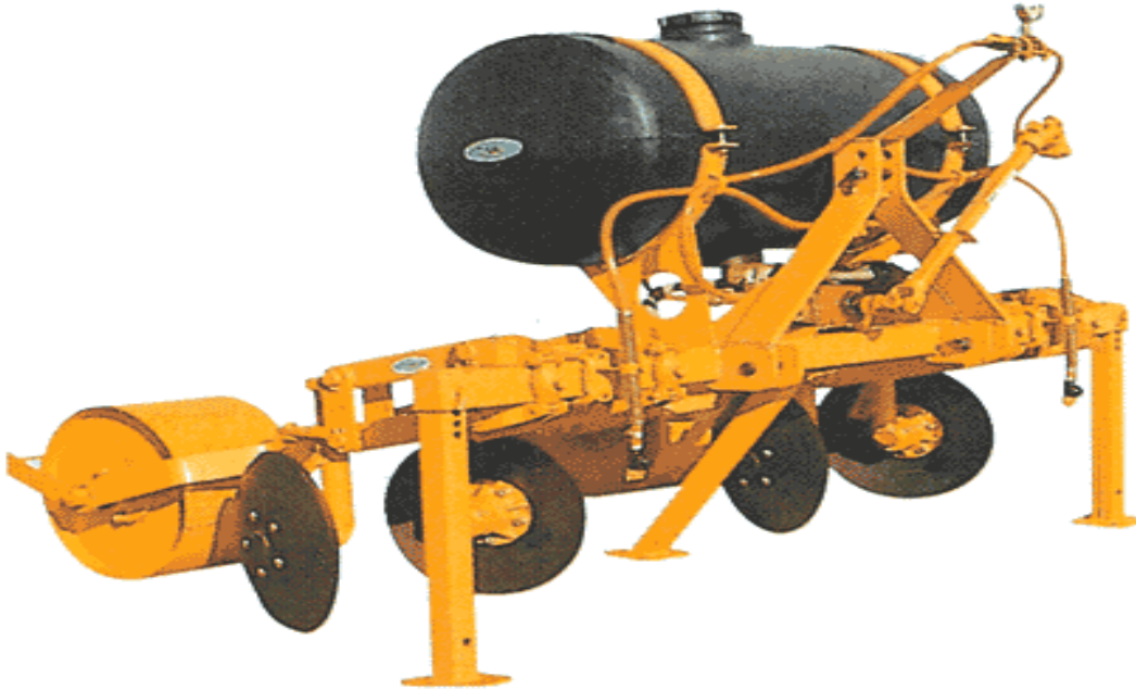
FIGURA 07: APLICADOR DE CANA PLANTA