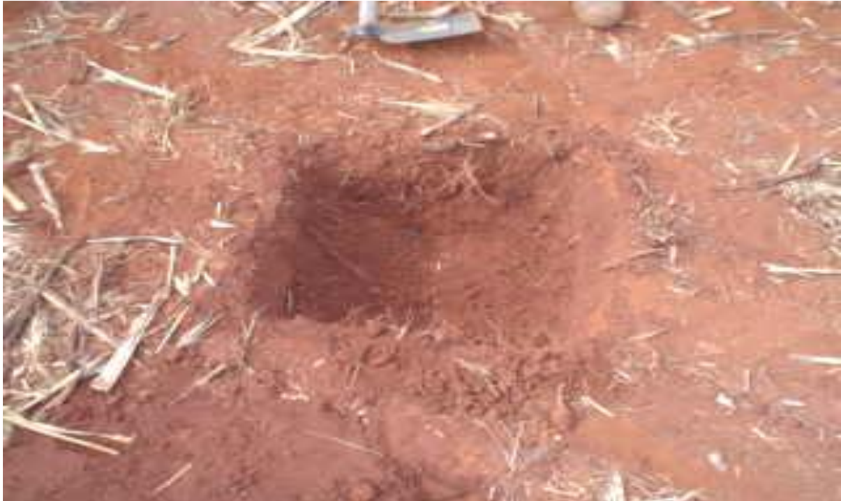
FIGURA 8. BURACOS 50CM X 50CM X 30CM