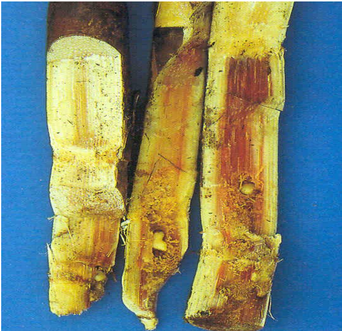
FIGURA 9. LARVAS DENTRO DOS COLMOS