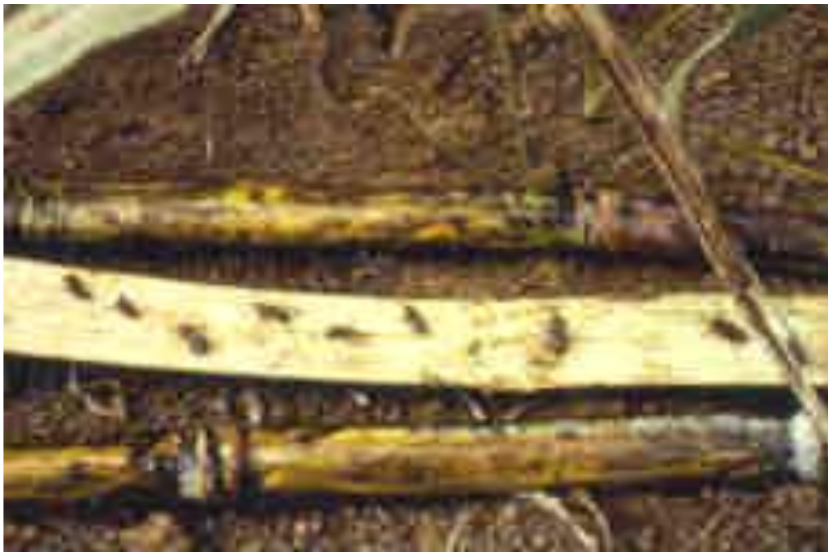
FIGURA 10: COLMOS CORTADOS COM INSETICIDA