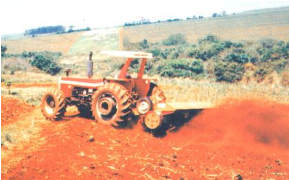
FIGURA 11: DESTRUIÇÃO DE SOQUEIRAS