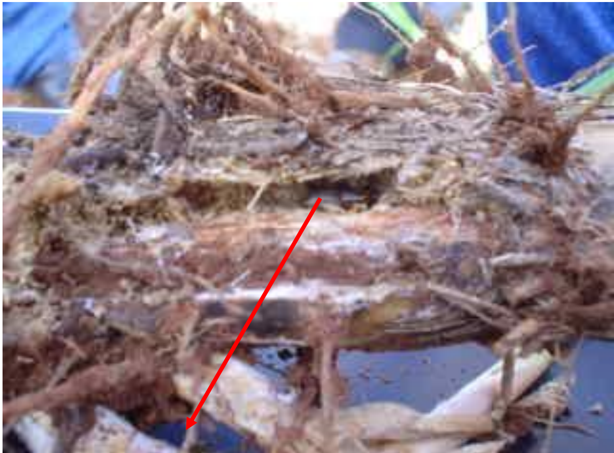
FIGURA 6. ADULTO NA RAÍZ DA CANA