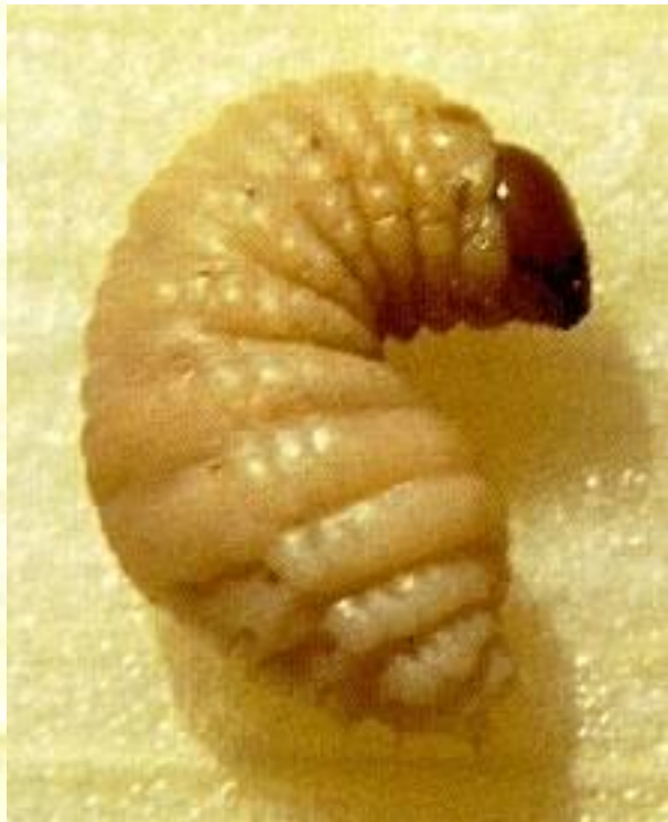
FIGURA 2. LARVA