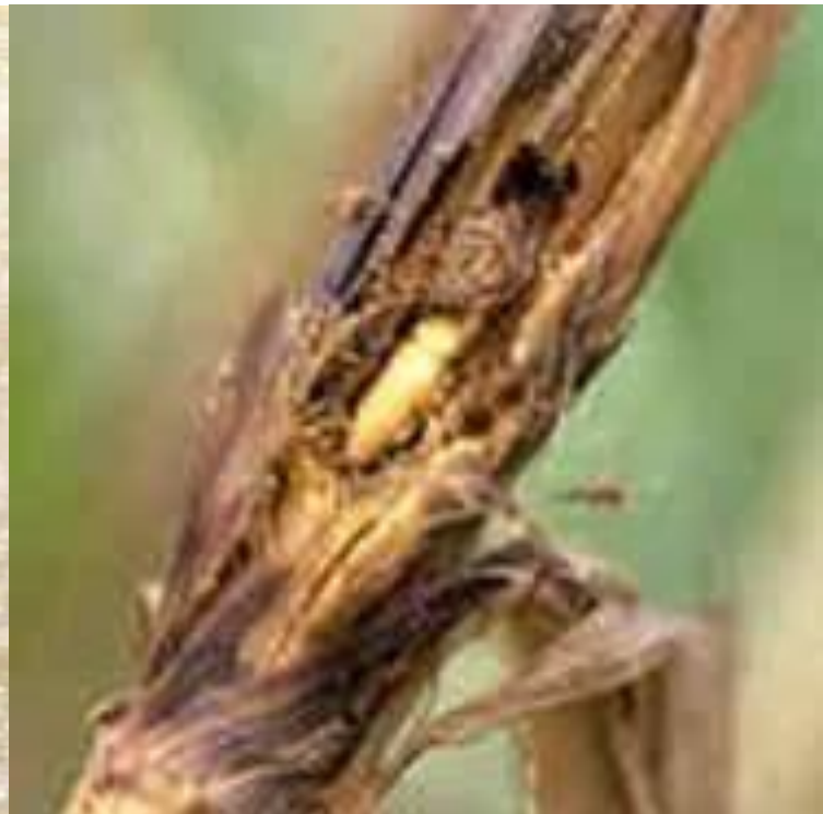
FIGURA 4. PUPA NO COLMO