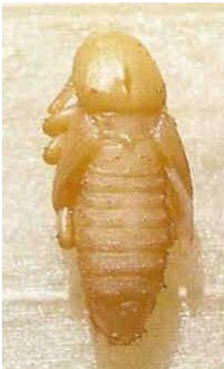
FIGURA 3. PUPA