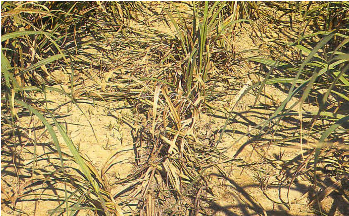
FIGURA 7. SINTOMA NA CANA